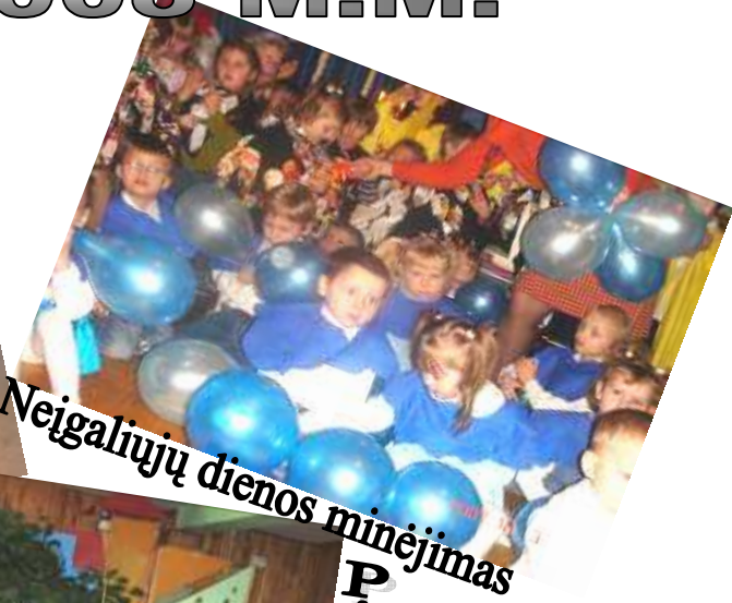
Neįgaliųjų dienos minėjimas