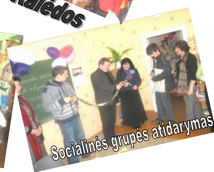
Socialinės grupės atidarymas